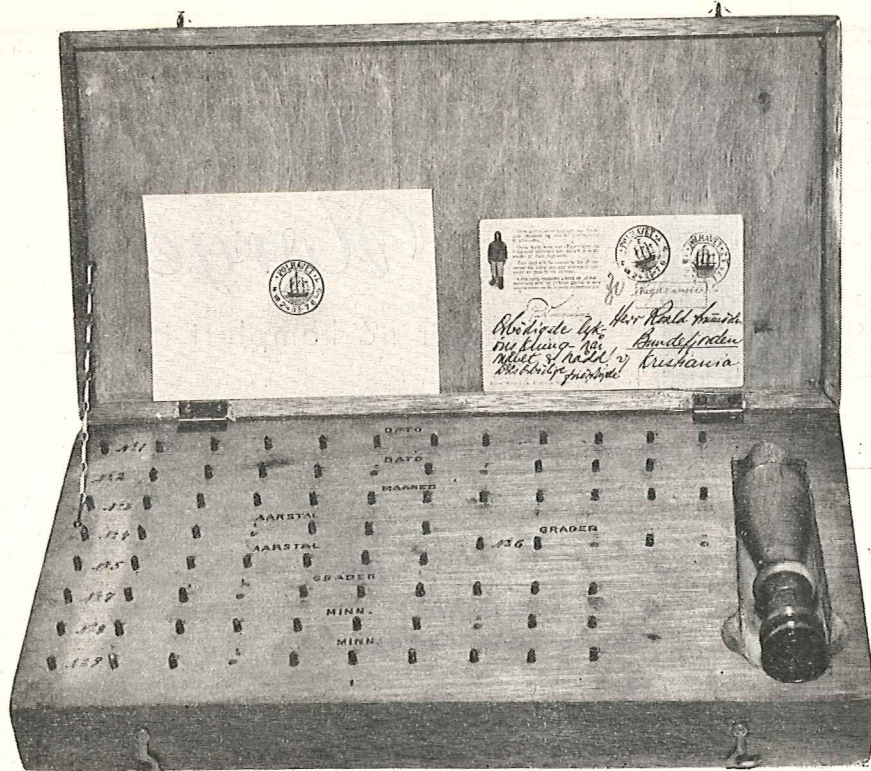
«Maud»s postkontor — framvist på møte i Oslo Filatelist-Klub. «Postkontoret» beror nå i Postmuseet.